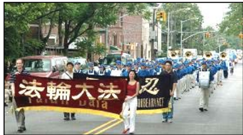
天国乐团参加游行声援二千万三退