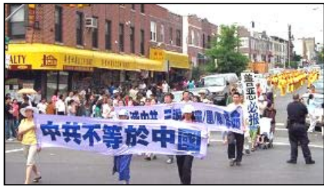
纽约民众声援大陆二千三百万民众三退。打出“中共不等于中国”的横幅