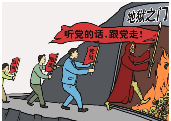
漫画：听党的话，跟党走，走入地狱门

行恶者固然有其可恨、可怜之处，而其幕后黑手是中共。大陆警察的出路只有摆脱中共附体，明辨是非，真正为自己的生命负责。◇