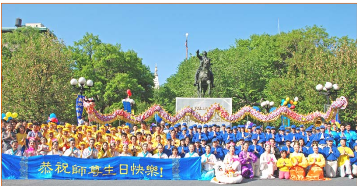
图：纽约法轮功学员在曼哈顿联合广场庆祝大法日