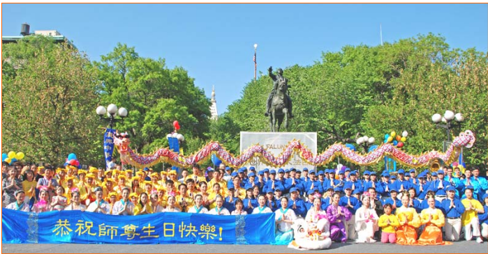
图：纽约法轮功学员在曼哈顿联合广场庆祝大法日

标准。前不久，劳教所对全体干警作了健康普查，其中五十二名恶警中，就没一个没病的。现已有十八人死亡、患绝症或遭其它严重恶报。