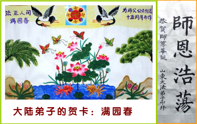
大陆法轮功学员给明慧网发来数千份贺电、贺卡和贺词，祝福师父生日，贺大法传世十五周年。