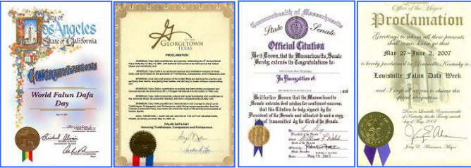
第八届世界法轮大法日期间，美、加各级政府发来贺状六十余份，褒奖法轮大法。