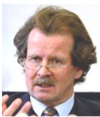
联合国酷刑问题 专员诺瓦克先生