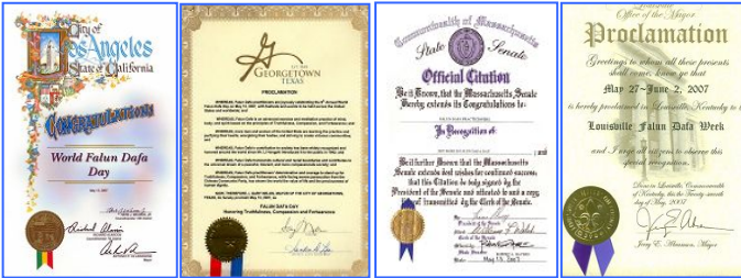
第八届世界法轮大法日期间，美、加各级政府发来贺状六十余份，褒奖法轮大法。

“第八届世界法轮大法日”期间，加、美、澳等国政要纷纷致函祝贺世界法轮大法日、褒奖法轮大法。加拿大总理斯蒂文·哈珀在给法轮功学员的贺信