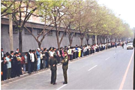
学员没有标语口号,没有阻塞交通。 警察无事闲聊天。

自焚是真的，那汽油一点着，可迅速达到四百一十度以上的高温，这个塑料瓶能耐几秒钟？实验证明，五秒钟瓶子开始变软，七秒钟收缩变形，十秒钟缩成一小疙瘩并燃烧。