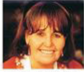
Baroness Caroline Cox