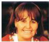
Baroness Caroline Cox