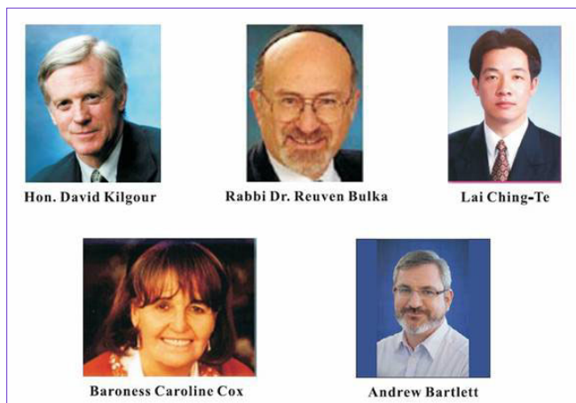
▲加拿大前国会议员大卫·乔高（上左）和“法轮功受迫害真相联合调查团”欧、亚、澳、北美四大分团团长

表达了对法轮功群体的关注，表示他们对法轮功学员在中国所遭受的八年迫害感同身受，对近期有关中共活体摘取法轮功学员器官的指控和调查尤感震惊，更担心正被关押在全国各地的数以十万计的法轮功学员的安危。公开信说，奥运会确是中国人民的一次机会，一如中国所承诺的那样，当国际社会善意的把奥运会举办权交给中国的时候，期望中国人民能在多方面受益——包括具有普世价值的人权。