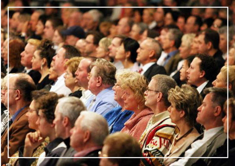
神韵艺术团震动严谨、保守的德国观众

在德国还有另外一个受迫害的团体，那就是犹太人。虽然他们人不生活在德国，但在德国，他们的存在人人都能感觉到，因为每年德国都有纪念二战的重大活动，届时德国总理、总统、各界政要都出席，为在二战中遭受纳粹迫害的犹太人献花圈、默哀，报纸上也头版头条发表大照片。这就是受迫害者：他们为他们自己的经历，为他们的同伴的经历而心情沉重，他们也在不断提醒人们不要忘记。他们的苦难也让人们无法忘记他们。