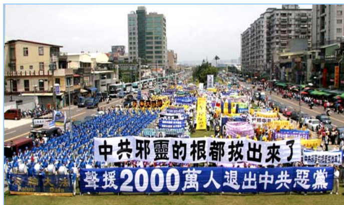
全球声援两千万人退出中共的大型活动已覆盖北美、欧洲及亚洲等十多个国家，声势浩大。图为四月十五日，近四千民众在台湾举行大游行，声援退党潮。

** 如果在 1991 年 8 月之前要是有人说苏共很快要垮台，人们一定会说这人是疯子。然而同年的 8 月 19 日，这个世界上最强大的共产党政权，在几天之间就被解体，震惊了世界。