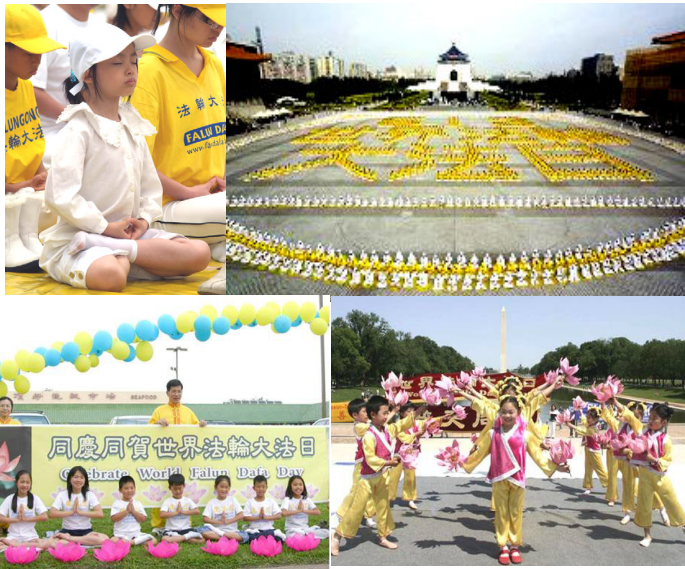
上图：台湾的法轮功学员在台北中正纪念堂广场以五千多名学员排出壮观的“五一三世界法轮大法日”。很多小弟子也带着庄重的神情参加了这次集体炼功。 左下图：休士顿中国城草坪上“普天同庆世界大法日”的条幅格外醒目。明慧学校小弟子参加了庆祝活动中的功法展示。 右下图：美国华盛顿林肯纪念堂前，庆祝大法日的活动多姿多彩。小弟子们表演的舞蹈“插莲花”博得众人掌声。

【明慧网】“一分为二”的看问题是混淆善恶的诡辩术，也是恶党党文化的一种惯用伎俩。是就是是，非就是非；善就是善，恶就是恶。这些根本就是混淆不了的，又怎么可能“一分为二”呢？ 比如，有的常人说，对大法也得“一分为二”的看。其根据是有的修大法的人也有错，这是由于一种没有因果关系的错误联系而得出的一种荒谬结论，这些人是被诡辩术给蒙住了。这就如同老师教学生的道理一样，老师告诉大家要做个好学生，而有的学生没有做好，你能说这个老师不好吗？学校的课本都是一样的，有的学生没有学好，你能说教材不好吗？所以，“法轮大法好”这就是绝对的。换句话说，法轮大法就是判断好与坏、正与邪的标准。