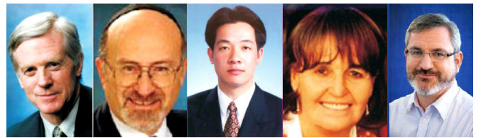
从左至右为加拿大前议员大卫·乔高；北美团长鲁文·鲍克；亚洲团长赖清德；欧洲团长卡罗琳·考克斯；澳洲团长安德鲁·巴列特

【明慧网】关注法轮功人权状况的国际性组织“法轮功受迫害真相联合调查团（CIPFG）”与独立调查员、加拿大前国会议员大卫·乔高，日前致函中国国家主席胡锦涛和国务院总理温家宝，希望他们能在未来两月内结束对法轮功群体和高智晟律师等良心人士的迫害，指出奥运会和属“反人类罪”的迫害在中国同时进行将是全人类的耻辱。