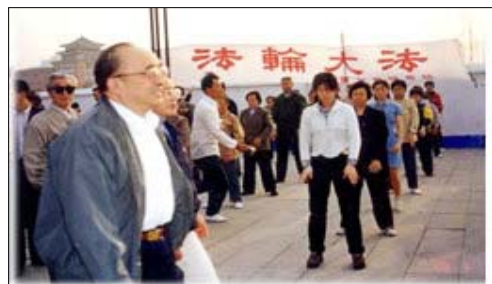
图为98年5月15日伍绍祖亲赴法轮功发祥地长春考察。

法轮功亦称法轮大法，是完整的一套性命双修的修炼方法。按照“真、善、忍”的标准修炼，除了修心还有五套功法用以修命。法轮功既是一种十分有效的健身功法，又是一种十分崇高的信仰。人们因修炼法轮功而无疾无病，人们因信仰“真、善、忍”而无私无恨。据中国协和医科大学副教授但凌等11位专家对北京市12731名法轮功学员的调查表明，其治病有效率达99.1%；98年9月，国家体育总局对广州等10个市约1.25万名法轮功学员就身心健康进行全面调查，祛病健身率达97.9%。至98年，上海东方电视台统计中国有一亿人修炼法轮功。98年下半年，以乔石为领导的全国人大组织详细调查，得出结论：法轮功于国于民有百利而无一害。◇