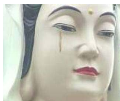
落泪的观音像和圣母玛利亚雕像