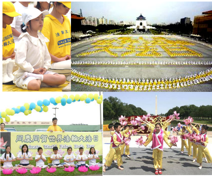
上图： 台湾的法轮功学员在台北中正纪念堂广场以五千多名学员排出壮观的“五一三世界法轮大法日”。很多小弟子也带着庄重的神情参加了这次集体炼功。