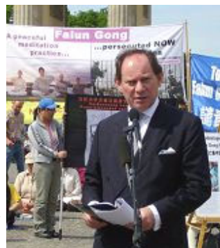
欧洲议会副主席史考特先生在集会上发言

【明慧网】二零零七年五月十四日，欧洲同盟与中共人权对话的前一天，欧洲法轮大法学会在柏林市区勃兰登堡门前广场举行集会，呼吁欧盟与中国进行公开的人权对话，而且对话内容应该真正涉及到中国每个人的人权问题，并要求欧盟公开谴责中共对中国民众的人权践踏。