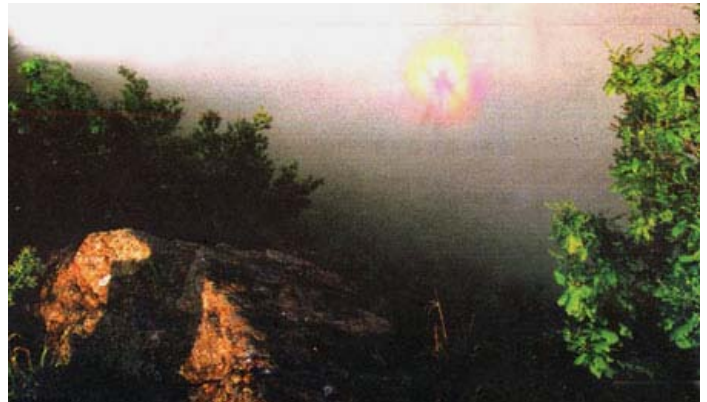
图片说明: 2005 年 8 月蛟河拉法山显现佛光奇景