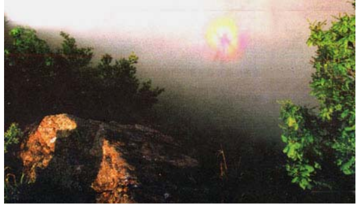
图片说明: 2005 年 8 月蛟河拉法山显现佛光奇景