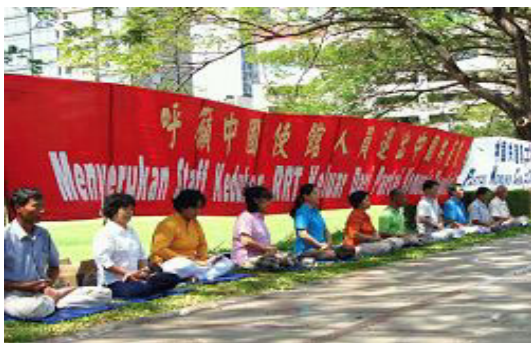
法轮功学员中使馆前声援退出中共