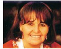
Baroness Caroline Cox