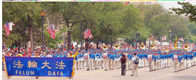
▲法轮功学员的精美花车和气势恢宏的“天国乐团”