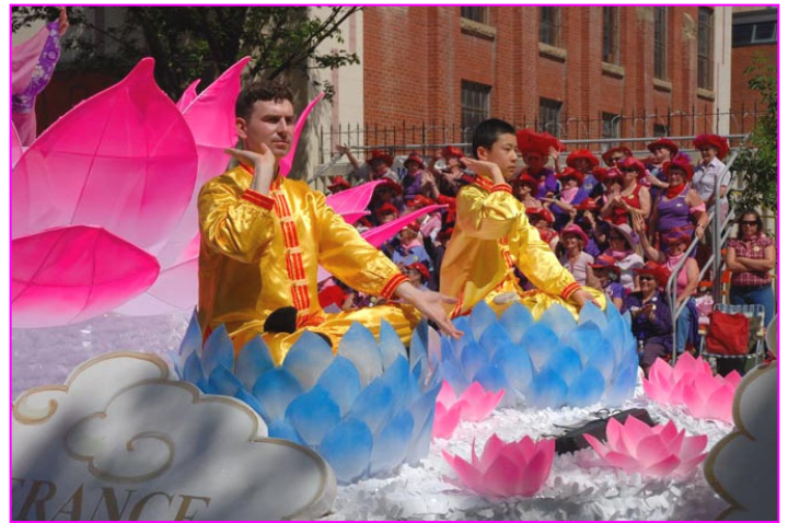
▲观众被漂亮的莲花和功法所吸引,报以热烈掌声。