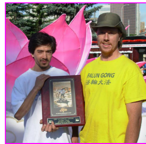
▲组委会给法轮大法颁发了三项奖。图为其中之一的名人奖。

【明慧网】一年一度的“地球上最大的户外活动”卡尔加里牛仔节,于零七年七月六日在加拿大卡尔加里开幕。在盛大的开幕式游行中,法轮大法团队以令人耳目一新的风貌,荣获组委会颁发的三个奖项:“坚韧的勇气”奖、贵宾名人奖、牛仔节特别奖,并受到当地民众与主流媒体的一致赞赏。