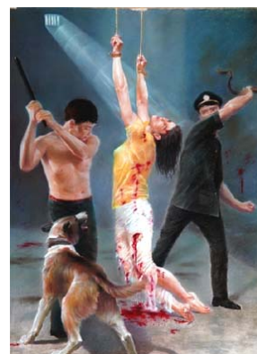
酷刑图示：吊刑、毒打、电击