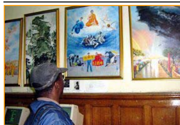
▲“真善忍美展”在南非开普顿市传播真相。2007.6.4