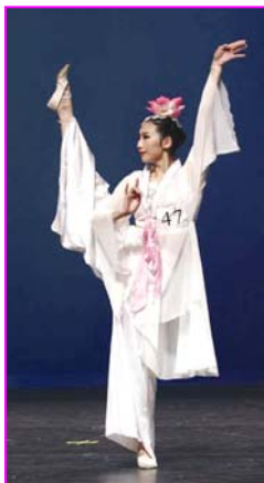
任凤舞的表演韵味十足

共领导人本身缺乏信心。法轮功学员坚持争取人权和自由，这一切都是值得的，千万不要气馁。