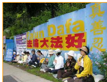
▲加拿大温哥华法轮功学员不分昼夜寒暑，24小时在中领馆前和平抗议，至今已持续近6年。