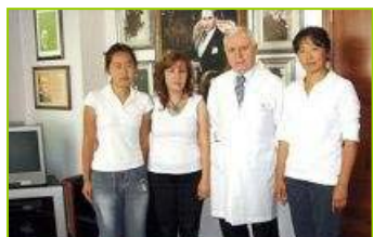
右二为土耳其器官移植协会主席兼首都大学校长迈哈迈德先生