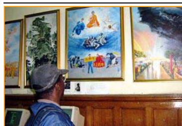
▲“真善忍美展”在南非开普顿市传播真相。2007.6.4