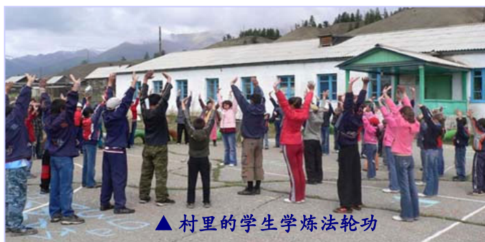
▲村里的学生学炼法轮功

【明慧网】在寒冷的俄罗斯西伯利亚地区有一个布里亚特自治共和国，这里地广人稀，在一个非常偏僻的小村子里，住着一千七百多个布里亚特人，村民以畜牧为生，很少知道外面世界的事。