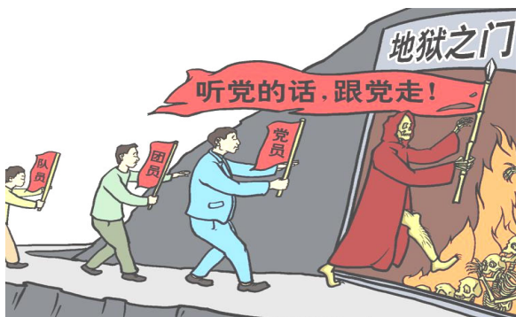
漫画：听党的话，跟党走，走入地狱门

怪吗？这就是为什么？——因为“自焚”是假的，是拍电影嫁祸法轮功，就是为了让咱老百姓上当！