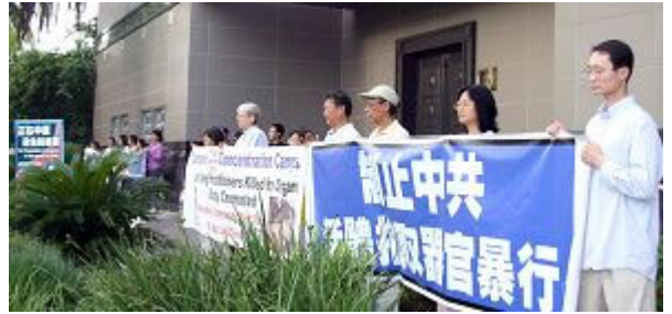
△二零零七年七月十七日晚，休士顿法轮功学员中领馆前悼念遭中共迫害致死的大陆同修，呼吁社会共同终止这场迫害

【明慧网】一九九九年七月二十日，中共前党魁江泽民一手发动了对法轮功的迫害，至今已长达八年；法轮功学员在这八年之中，坚持“真、善、忍”信念，和平抗争，走的是和平理性反迫害之路。八年来法轮功学员的反迫害，就是告诉世人：法轮功信仰的是“真、善、忍”，告诉世人：法轮功学员被迫害的真相。法轮功学员用各种方式唤醒人们的善念良知，呼吁终结这场浩劫。