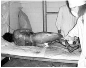
烧伤病人要在空气中晾着，护理人员要穿卫生服，戴口罩以防感染。

此情此景，我们又想起了所谓的“天安门自焚”事件的情况，人们可曾记得，所有的严重烧伤人员，身体都用白纱布包扎得严严实实，