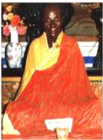
广东韶关南 华寺内的慧 能肉身像

了解中华传统文化的人，对这些现象并不感到惊奇。因为，修炼可以改变人身的物质结构，即所谓“走出三界外，不在五行中”。从修炼的角度来看，高僧在修炼过程中，其肉身已被另外空间的高能量物质所代替，不再受我们这个空间时空规律的制约，所以经久不腐。◇