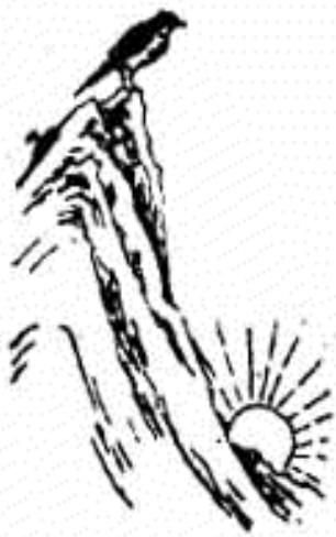
《推背图》第三十九象

唐贞观年间的《推背图》六十象；北宋隐士邵雍的《梅花诗》十首；明朝开国宰相刘伯温的《烧饼歌》；高丽学者南师古480年前撰的《格庵遗录》；16世纪法国著名预言家诺查丹玛斯的《诸世纪》，这些书中对社会大事件的预言99%都已被证实，其准确度令看过这些书的人目瞪口呆。