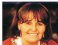
Baroness Caroline Cox