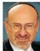
Rabbi Dr. Reuven Bulka