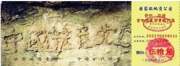
▲掌布风景区门票上“中国共产党亡”的照片

在豫北太行山脉有一块奇特的石头，能发出一种猪叫般的声音，当地人叫它“猪叫石”。每当有什么大事要发生的时候，“猪叫石”都会叫。这几年“猪叫石”又开始狂叫了，到底要发生什么大事呢？也许人们还在猜测，但是看一看贵州平塘县“亡共石”，也许可解谜。在贵州平塘县掌布风景区发现了一块二亿七千万年前的藏字石，这块石头自高崖坠地后，一分为二。二零零二年六月被当地村民发现藏字，藏字可辨有六个大字“中国共产党亡”，这是国内一百多家媒体包括新华社、中央台等，都有过报导和专题，网上也能搜索到相关照片。当然，他们都不敢报最后一个字。经专家鉴定，这些字都是天然形成的，从概率