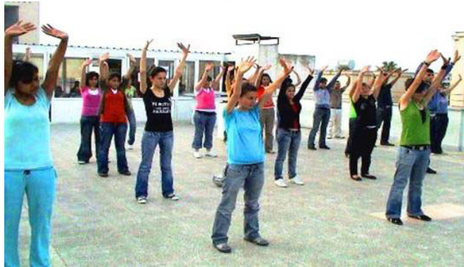
土耳其学生学炼法轮功

【明慧网】二零零七年五月六日，应墨尔逊市 Bilge Elit Dershanesi 学校校长的邀请，两位法轮功学员在该校举办了一场关于法轮功的专题介绍会并现场教功。