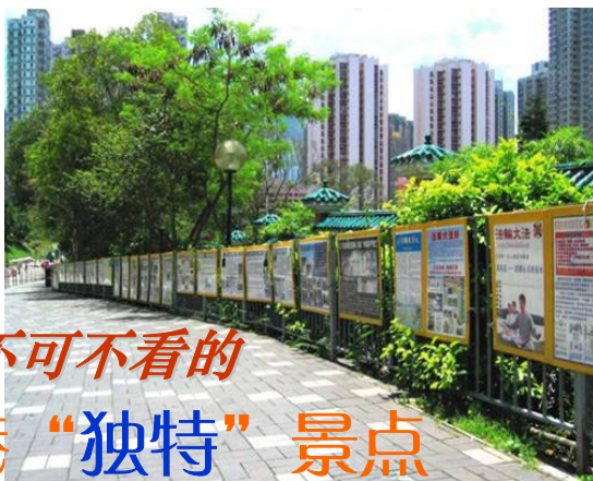
不可不看的 香港“独特”景点

她还会对大陆游客说：“共产党不代表中国，爱国并不是爱党，共产党执政五十八年，在多次政治斗争中，害死了八千万中国人。共产党灭绝人性活摘法轮功学员器官，贩卖图利，天理不容。（海外媒体对此广泛报道，现在正义之士时刻准备进入大陆调查真相）天灭中共在即，所有党、团、队员不退出都会跟着遭殃，赶快