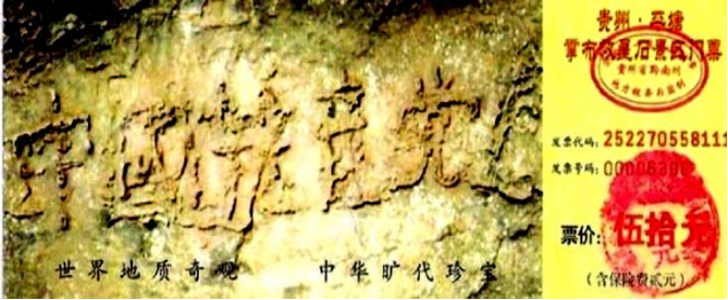
▲掌布风景区门票上“中国共产党亡”的照片 27

天上飞沙，地上走石，天象来临，必有石情。奇石异象不仅历史上有记载，当今社会也正显现，自古奇石出世、人间必有大事发生。