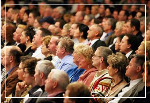
神韵艺术团震动严谨、保守的德国观众

然而法轮功所做的，不仅是在被中共迫害的过程中积极广泛的揭露中共的迫害，而且在受中共迫害的过程中，付出了巨大努力，为世人提供了中华神传文化的盛筵、为这个世界播撒通往光明未来的福音。