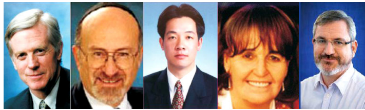
从左至右为加拿大前议员大卫·乔高；北美团长鲁文·鲍克；亚洲团长赖清德；欧洲团长卡罗琳·考克斯；澳洲团长安德鲁·巴列特

立即停止对法轮功群体和其支持者的迫害，并就“活摘器官”的指控，接受国际社会的核实查证。