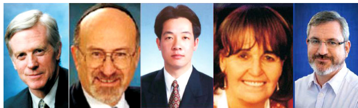
从左至右为加拿大前议员大卫·乔高；北美团长鲁文·鲍克；亚洲团长赖清德；欧洲团长卡罗琳·考克斯；澳洲团长安德鲁·巴列特

立即停止对法轮功群体和其支持者的迫害，并就“活摘器官”的指控，接受国际社会的核实查证。