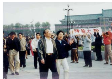
图为98年5月15日伍绍祖亲赴法轮功发祥地长春考察。

据中国协和医科大学副教授但凌等11位专家对北京市12731名法轮功学员的调查表明，其治病有效率达 99.1% ；98年9月，国家体育总局对广州等10个市约1.25万名法轮功学员就身心健康进行全面调查，祛病健身率达 97.9% 。至98年，上海东方电视台统计中国有一亿人修炼法轮功。98年下半年，以乔石为领导的全国人大组织详细调查，得出结论：法轮功于国于民有百利而无一害。◇