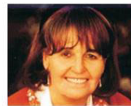
Baroness Caroline Cox