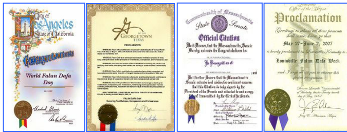
第八届世界法轮大法日期间，美、加各级政府发来贺状六十余份，褒奖法轮大法。

“第八届世界法轮大法日”期间，加、美、澳等国政要纷纷致函祝贺世界法轮大法日、褒奖法轮大法。加拿大总理斯蒂文·哈珀在给法轮功学员的贺信中，向为国家多元化做出贡献的众多法轮功学员表达诚挚的祝福。美国新墨西哥州州长在褒奖状中写到：法轮大法是一种古老的包括动功和打坐的自我修炼系统，强调同化宇宙原理“真、善、忍”；法