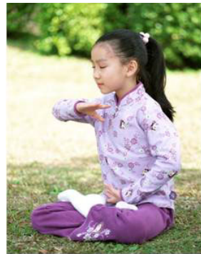
信仰无罪 停止迫害

近八年来，中共与江泽民互相利用迫害法轮功，欲“在三个月内消灭法轮功”。置所有法轮功修炼者于死地而后快，采用“名誉上搞臭、经济上截断、肉体上消灭”，“打死算自杀”等灭绝政策。法轮功学员做好人的权利被强权剥夺，一个“炼”字即可判刑入监。而且强加给法轮功的政治定性不断升级，以此大肆绑架、抓捕法轮功学员，劳教、判刑，残害法轮功学员。