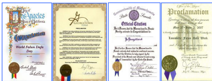
第八届世界法轮大法日期间，美、加各级政府发来贺状六十余份，褒奖法轮大法。

“第八届世界法轮大法日”期间，加、美、澳等国政要纷纷致函祝贺世界法轮大法日、褒奖法轮大法。加拿大总理斯蒂文·哈珀在给法轮功学员的贺信中，向为国家多元化做出贡献的众多法轮功学员表达诚挚的祝福。美国新墨西哥州州长在褒奖状中写到：法轮大法是一种古老的包括动功和打坐的自我修炼系统，强调同化宇宙原理“真、善、忍”；法