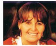
Baroness Caroline Cox