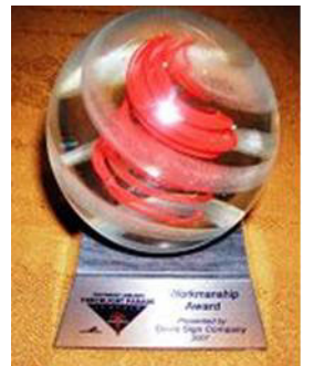
法轮功「大法船」花车荣获最佳「制造工艺」奖

【明慧网】第五十八届“海洋节炬光游行”于七月二十八日晚在西雅图市中心的大道上举行。在现场三十万观众的欢呼声中，在电视机前七十万观众的期待中，法轮功队伍以气势磅礴的二百人阵容，展现了从现代西方文明到东方神传文化、从人间至天国的美好景象。法轮功浩浩荡荡的“天国乐团”令人赞叹不已；恢宏精美的“大法船”更令人叹为观止。电视七台评论员向观众介绍时说，“这是从古老庄严的唐朝直接驶来的法轮功‘大法船’花车。她获得了今年的最佳‘制造工艺’，非常绚丽多彩，具有非常的想象力！”