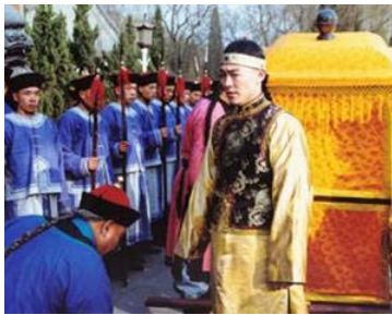
▲姜光宇《雍正王朝》剧照

后来我想到法轮功蒙受这样不白之冤，我不能光想得到，不去付出，我得站出来说句公道话。所以 2000 年我又一次到中央信访办上访，后来被非法拘留了。因