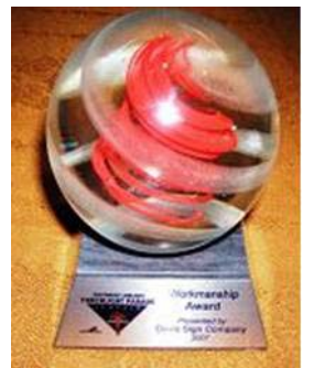
法轮功「大法船」花车荣获最佳「制造工艺」奖

【明慧网】第五十八届“海洋节炬光游行”于七月二十八日晚在西雅图市中心的大道上举行。在现场三十万观众的欢呼声中，在电视机前七十万观众的期待中，法轮功队伍以气势磅礴的二百人阵容，展现了从现代西方文明到东方神传文化、从人间至天国的美好景象。法轮功浩浩荡荡的“天国乐团”令人赞叹不已；恢宏精美的“大法船”更令人叹为观止。电视七台评论员向观众介绍时说，“这是从古老庄严的唐朝直接驶来的法轮功‘大法船’花车。她获得了今年的最佳‘制造工艺’，非常绚丽多彩，具有非常的想象力！”◇