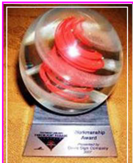
法轮功「大法船」花车荣获最佳「制造工艺」奖

【明慧网】第五十八届“海洋节炬光游行”于七月二十八日晚在西雅图市中心的大道上举行。在现场三十万观众的欢呼声中，在电视机前七十万观众的期待中，法轮功队伍以气势磅礴的二百人阵容，展现了从现代西方文明到东方神传文化、从人间至天国的美好景象。法轮功浩浩荡荡的“天国乐团”令人赞叹不已；恢宏精美的“大法船”更令人叹为观止。电视七台评论员向观众介绍时说，“这是从古老庄严的唐朝直接驶来的法轮功‘大法船’花车。她获得了今年的最佳‘制造工艺’，非常绚丽多彩，具有非常的想象力！”◇