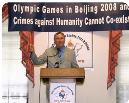
美国国会议员达纳·罗拉巴克

全球“法轮功受迫害真相联合调查团”（简称 CIPFG）代表在新闻发布会上宣布，由该组织所发起并由多个人权团体支持参与的“人权圣火全球巡回传递活动”圣火点火仪式，将于八月九日在希腊雅典举行。预计雅典起跑后大约一年之内，传遍五大洲数十个国家上百座城市。联合调查团希望借着传递人权圣火，呼吁国际社会正视中共违背奥运精神、侵犯人权迫害异己的恶劣人权状况，制止中共活体摘取法轮功学员器官牟利的反人类暴行，不要让二零零八年奥运沦为“血腥奥运”。