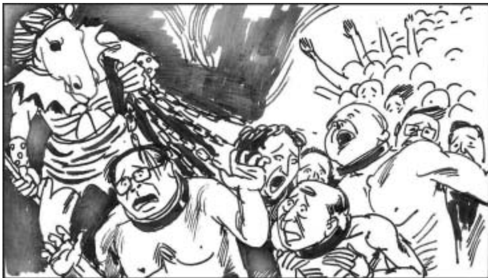
7. 其四为‘平等无间’，无论男女，亦不论前世身份，同样平等无间，同样要受刑。