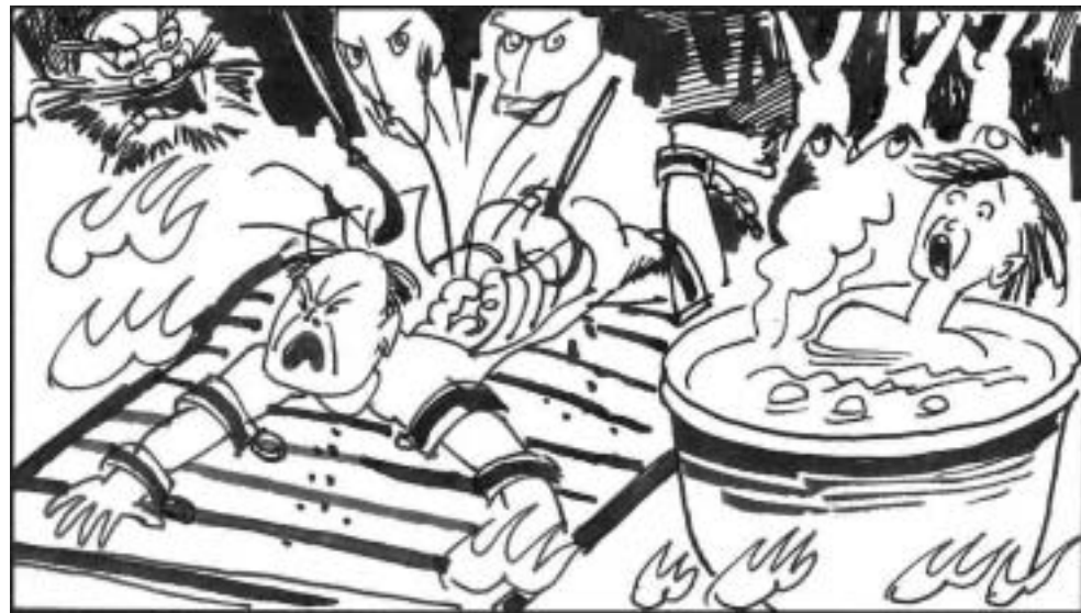
6. 其三为‘罪器无间’，即刑罚的器具没有间断，不停用各式各样的刑具用刑。