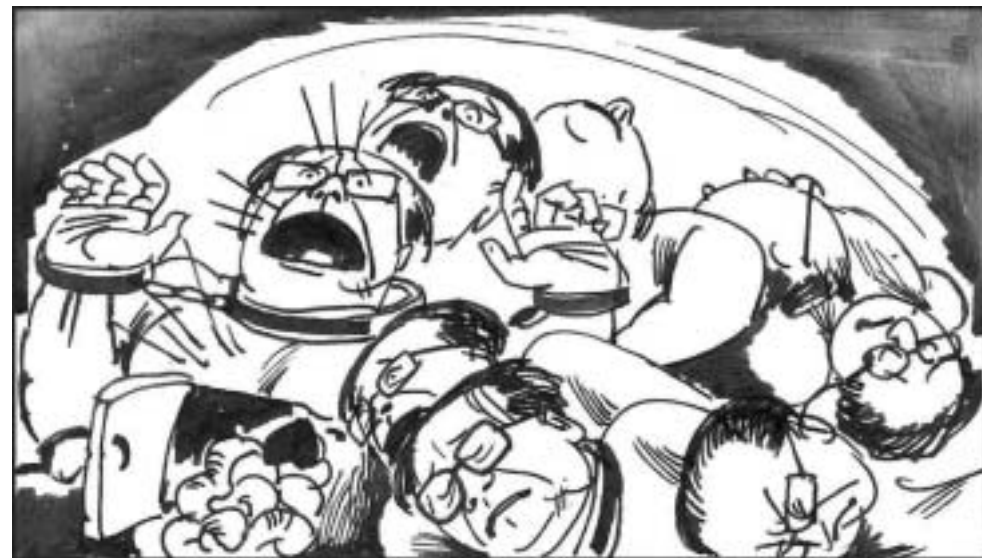
8. 其五为‘生死无间’，受刑人每一刻既痛苦而死，但又活过来继续受刑。生命在层层灭尽中的痛苦，永无停息。此为宇宙中最可怕之事了。”