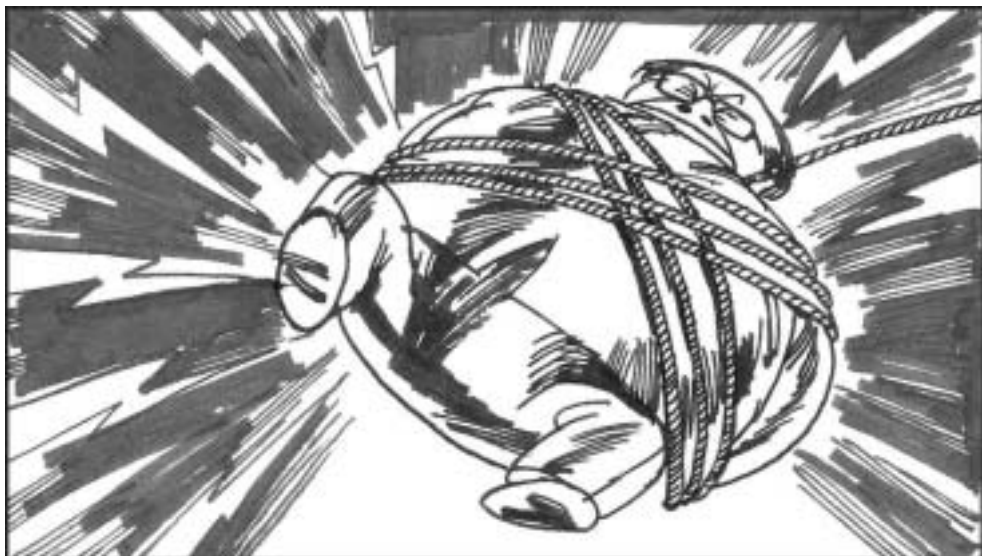
11. 话音刚落，一根绳索从天而降将江泽民从头到脚牢牢捆住，倒挂在半空中，片刻之间，风雷大起。万千闪电同时击在江泽民的每一寸肌肤上，江泽民整个身躯全被雷火消灭殆尽，未留一点残余。