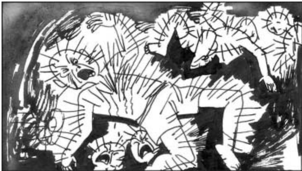
5. 其二为‘空无间’，受刑者全身每一处皆在受刑，毫无间断。