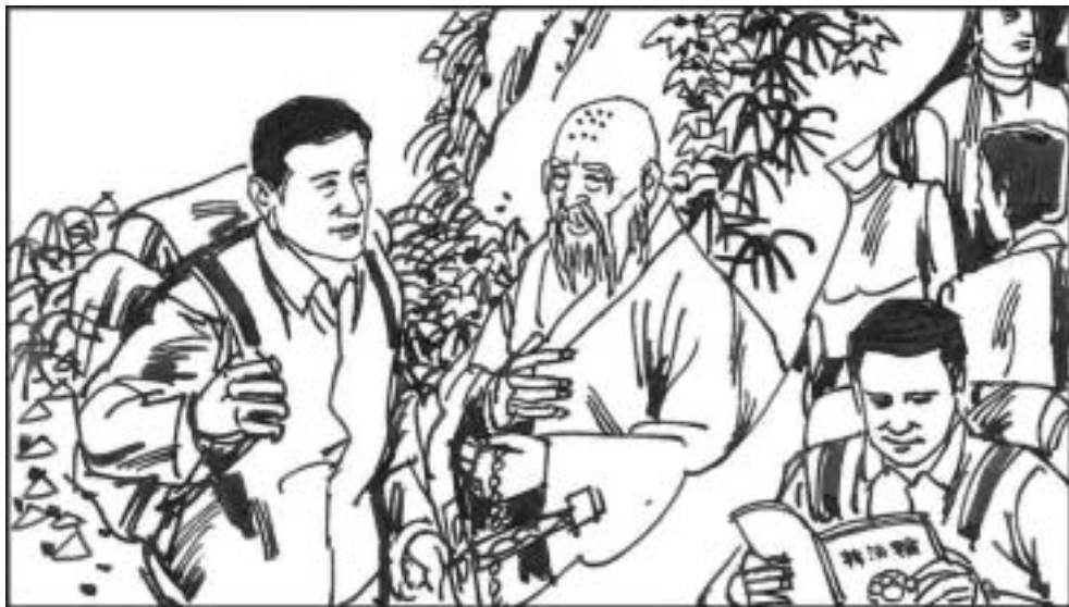
9. 传灯听老僧讲法，对老僧言语深信不疑，次日下山寻了一本《转法轮》，依法修行去了。