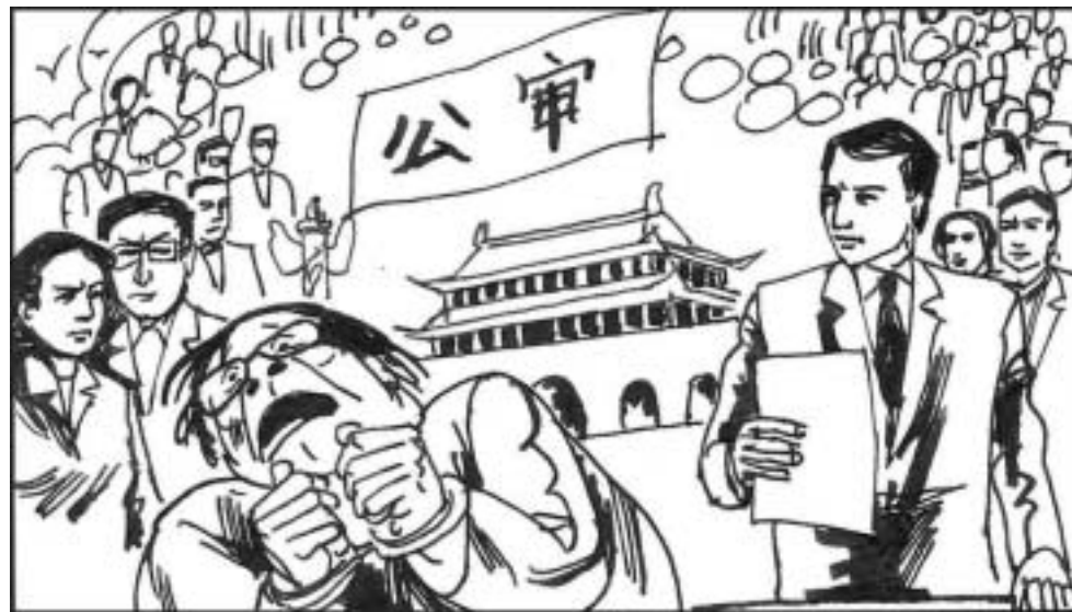
10. 某年月日，全球审江大联盟联络各国大法官组成陪审团，在天安门广场对江泽民进行公审，陪审团宣读江罪状达上千页，最后以叛国罪、贪污罪、酷刑罪、反人类罪、群体灭绝罪等等判处江泽民极刑。