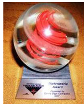
法轮功「大法船」花车荣获最佳「制造工艺」奖

【明慧网】第五十八届“海洋节炬光游行”于七月二十八日晚在西雅图市中心的大道上举行。在现场三十万观众的欢呼声中，在电视机前七十万观众的期待中，法轮功队伍以气势磅礴的二百人阵容，展现了从现代西方文明到东方神传文化、从人间至天国的美好景象。法轮功浩浩荡荡的“天国乐团”令人赞叹不已；恢宏精美的“大法船”更令人叹为观止。电视七台评论员向观众介绍时说，“这是从古老庄严的唐朝直接驶来的法轮功‘大法船’花车。她获得了今年的最佳‘制造工艺’，非常绚丽多彩，具有非常的想象力！”◇