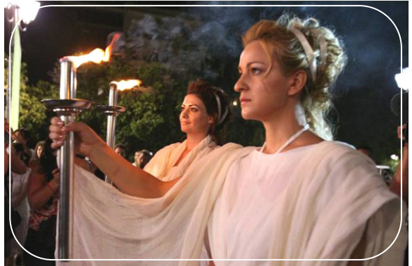
八月九日晚，“人权圣火”在希腊点燃

【明慧网】中央社八月十五日报导，「法轮功受迫害真相联合调查团」和德国的法轮功学员，周末在德国首都柏林展开奥运人权圣火传递活动，呼吁各界正视中共活体摘取法轮功学员器官牟利和迫害法轮功的行为。