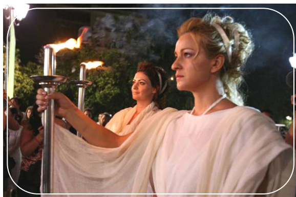
八月九日晚，“人权圣火”在希腊点燃

【明慧网】中央社八月十五日报导，「法轮功受迫害真相联合调查团」和德国的法轮功学员，周末在德国首都柏林展开奥运人权圣火传递活动，呼吁各界正视中共活体摘取法轮功学员器官牟利和迫害法轮功的行为。