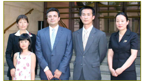
律师(右三)和法轮功证人在西班牙国家法院前

莫拉七月三十日上午，在马德里与三位来自不同国家的证人见面，就法轮功学员递交的起诉贾庆林酷刑罪、反