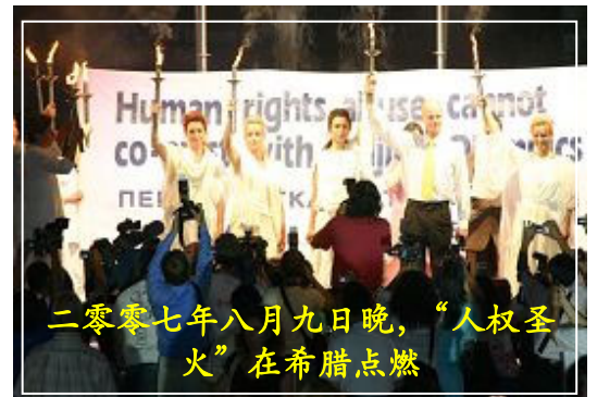
二零零七年八月九日晚，“人权圣火”在希腊点燃