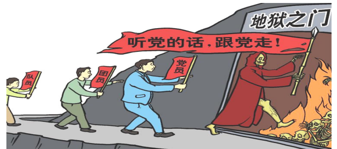
漫画：听党的话，跟党走，走入地狱门口

二零零二年机关组织体检时确诊为胃癌，手术后出院回家说很好了，可是回家不久就死了。