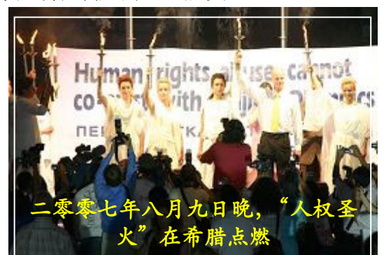
二零零七年八月九日晚，“人权圣火”在希腊点燃