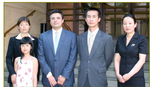
律师(右三)和法轮功证人在西班牙国家法院前

莫拉七月三十日上午，在马德里与三位来自不同国家的证人见面，就法轮功学员递交的起诉贾庆林酷刑罪、反