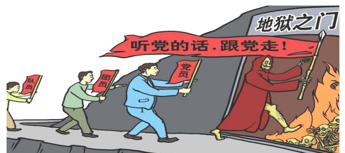
漫画：听党的话，跟党走，走入地狱门口

二零零二年机关组织体检时确诊为胃癌，手术后出院回家说很好了，可是回家不久就死了。