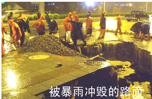
被暴雨冲毁的路面