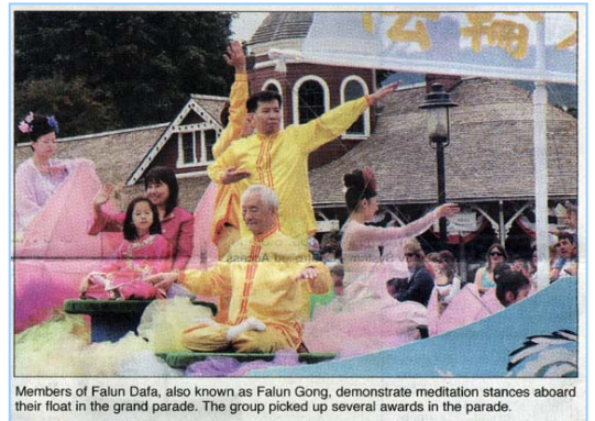
Members of Falun Dafa, also known as Falun Gong, demonstrate meditation stances aboard their float in the grand parade. The group picked up several awards in the parade.