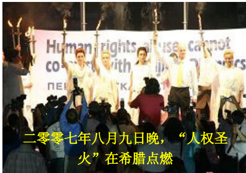
二零零七年八月九日晚，“人权圣火”在希腊点燃

时至今日，中共对三项诉求不仅没做出明确的答复，反而拒绝为 CIPFG 成员进入中国调查发放签证，同时对法轮功、宗教人士、维权者的迫害