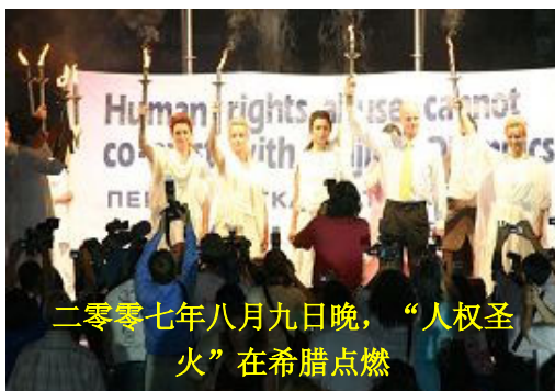
二零零七年八月九日晚，“人权圣火”在希腊点燃

时至今日，中共对三项诉求不仅没做出明确的答复，反而拒绝为 CIPFG 成员进入中国调查发放签证，同时对法轮功、宗教人士、维权者的迫害