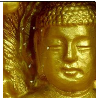
2005年，韩国须弥山禅院的菩萨像面部开了10朵婆罗花

根据佛经记载，优昙婆罗为梵语，意为灵瑞花、空起花、起空花。《慧琳音义》卷八载明：“优昙婆罗花为祥瑞灵异之所感，乃天花，为世间所无，若如来下生、金轮王出现世间，以大福德力故，感得此花出现。”“金轮王出现世间”即解为，优昙婆罗的出现意味着转轮圣王下世在人间正法。