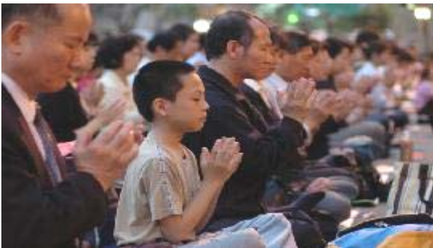
（上图：台湾法轮功学员强烈抗议中共法西斯兽行） 5

本小册子旨在系统曝光在牡丹江市镇压法轮功的邪恶运动中充当恶棍的残暴恶人的恶行恶报，作恶者不相信法网恢恢、善恶有报的天理，践踏法律，无法无天。善良的人们，请用你们的良知和善心，认清这场惨无人道的迫害，揭露恶