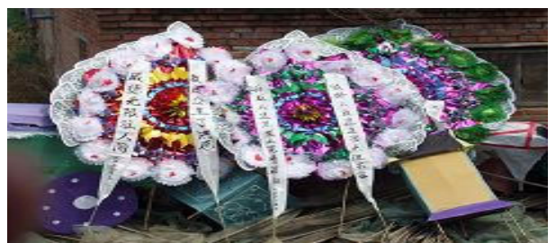
诉说冤情的花圈和挽联

所有参与迫害我丈夫的人，面对我丈夫的死，你们能心安理得吗？善恶必报是天理。你们做的恶能不还吗？希望你们不要再助纣为虐，停止迫害好人。不希望我家的悲剧再重演。