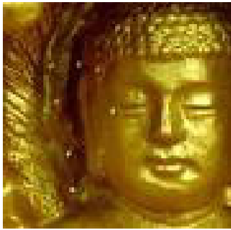
佛像上出现佛家传说中的优昙婆罗花

说这种“优昙婆罗花”每3000年开花一次，而当花出现的时候，意味着将有转轮圣王在人间正法。