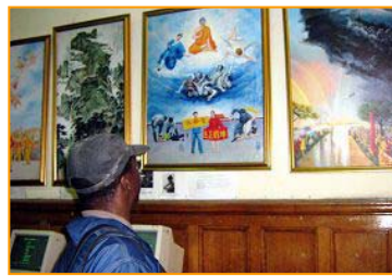
▲“真善忍美展”在南非开普顿市传播真相。2007.6.4

◀影片《伪火》真实揭露了自焚骗局,获第五十一届哥伦布国际电影电视节荣誉奖。国际教育发展组织在二零零一年八