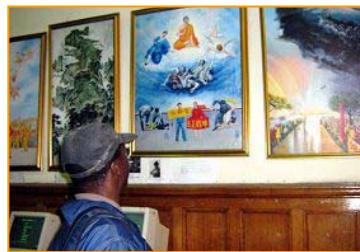
▲“真善忍美展”在南非开普顿市传播真相。2007.6.4