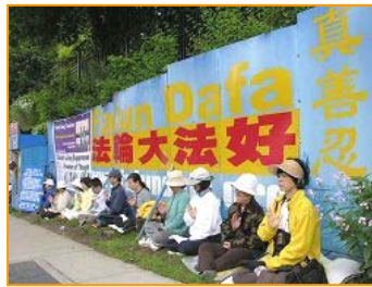
▲加拿大温哥华法轮功 学员不分昼夜寒暑，24 小 时在中领馆前和平抗议， 至今已持续近 6 年。