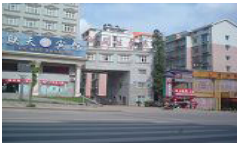
劳教所位于长沙市新开设，大门上书“湖开生产区”（即湖南开关厂）。

C 区表面上是劳教人员娱乐场所，但一般很少开放，刚进新开设的法轮功学员，以及要求炼功、喊“法轮大法好”的法轮功学员被转到 C 区进行残酷迫害，这里的地面、墙壁、窗帘上经常是斑斑血迹。