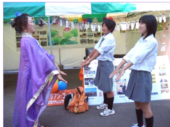
▲校庆上日本学生在学炼法轮功

【明慧网】位于仙台的日本东北大学是著名的综合性大学，人才辈出，今年迎来一百周年的校庆。在庆典上法轮功学员的展位受到了各国留学生的关注。大家通过看板上的照片了解到法轮功洪传八十多个国家和地区的情况。看到身着唐朝传统服装的女学员展示的功法，很多人跃跃欲试，想亲自体验一下这神奇的功法。也有的参观者希望知道有关法轮功更详细的情况，有的得知这么好的功法在中国大陆却遭到打压感到不可理解，表示希望中国大陆早日结束中共的独裁统治，人们能自由的炼自己喜欢的功法。◇