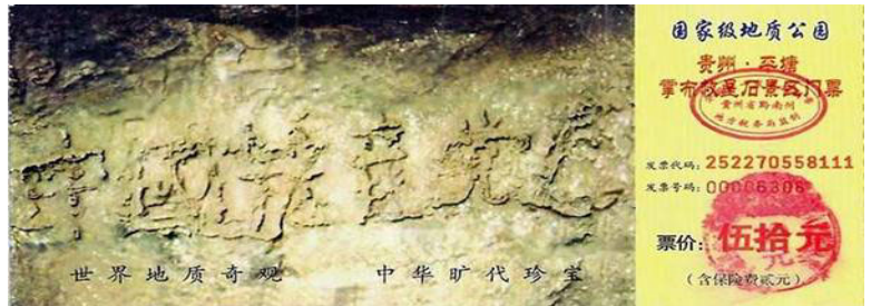
上图为贵州省平塘县掌布乡国家地质公园门票

二零零二年六月在掌布乡发现的距今 2.7 亿年的“藏字石”，五百年前崩裂的巨石断面惊现六个大字：“中國共產党亡”。此奇观被国内一百多家报纸、电视、网站报道，只不过没人敢提那个“亡”字。经中国科学文化考察团专家们深入实地考察后认定：“字是天然生成，至今未发现人工雕凿及其它人为加工痕迹”（详情可在 baidu.com 和 google.com 上搜索）。