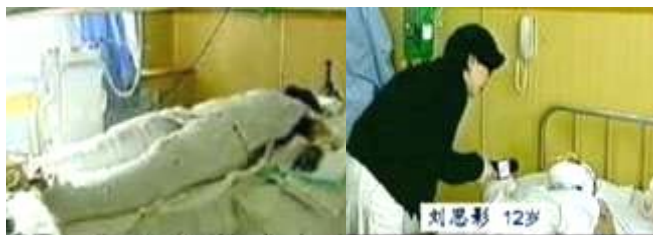
央视《焦点访谈》中的“自焚者”被包裹得严密